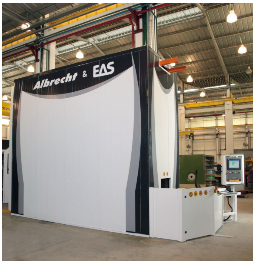
Modelo para armazenagem de corantes